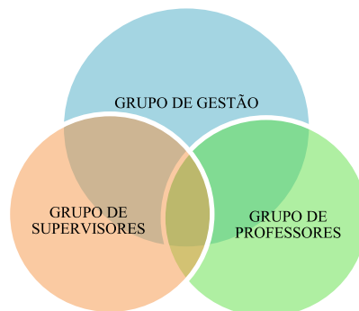
Relação dos profissionais em diferentes setores da escola no grupo de WhatsApp